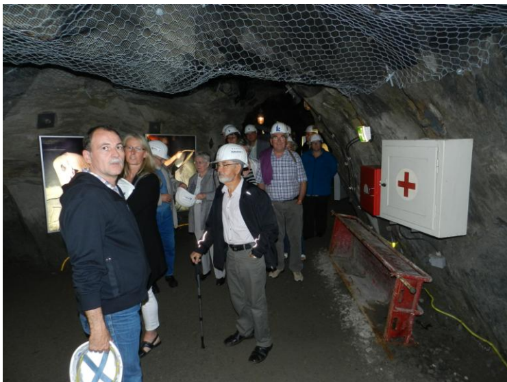
Im Bergwerksmuseum Mayen