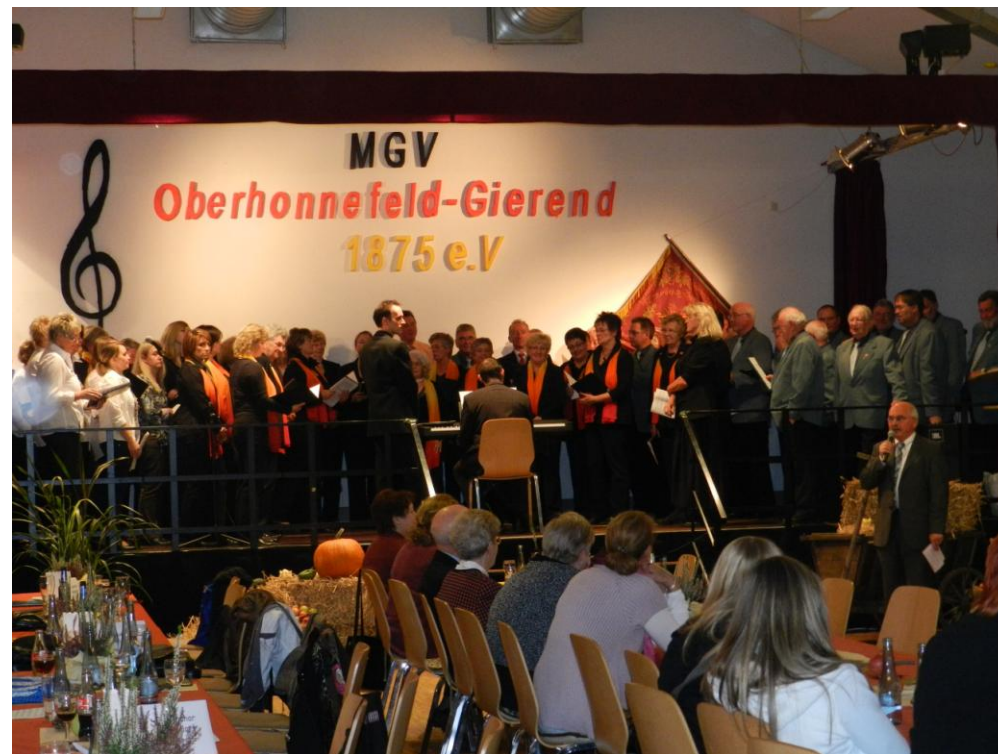
Gemeinsamer Auftritt des Frauenchors Rengsdorf, des MGV und Frauenchors Hümmerich und des MGV Oberhonnfeld-Gierend

Am letzten Oktoberwochenende hatte der MGV zahlreiche befreundete Chöre aus nah und fern zu seinem, erstmalig stattfindenden, Herbstfest der Chormusik eingeladen.