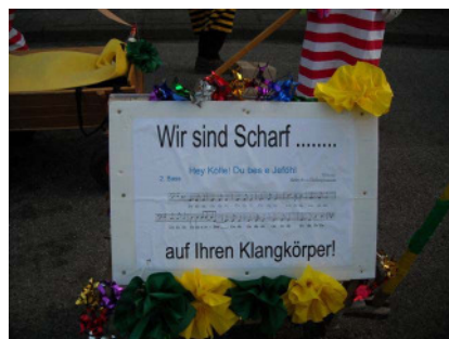
Der Motivwagen des MGV

Aktive Mitglieder des Männergesangsvereins beteiligten sich mit einer Fußgruppe am diesjährigen Karnevalsumzug in Oberhonnefeld-Gierend. Es hat den beteiligten Sängern so viel Spaß gemacht, dass man schon jetzt Pläne für das nächste Jahr schmiedet. Auch dies ist ein Beispiel dafür, wie sich die Vereine im Dorf gegenseitig unterstützen.