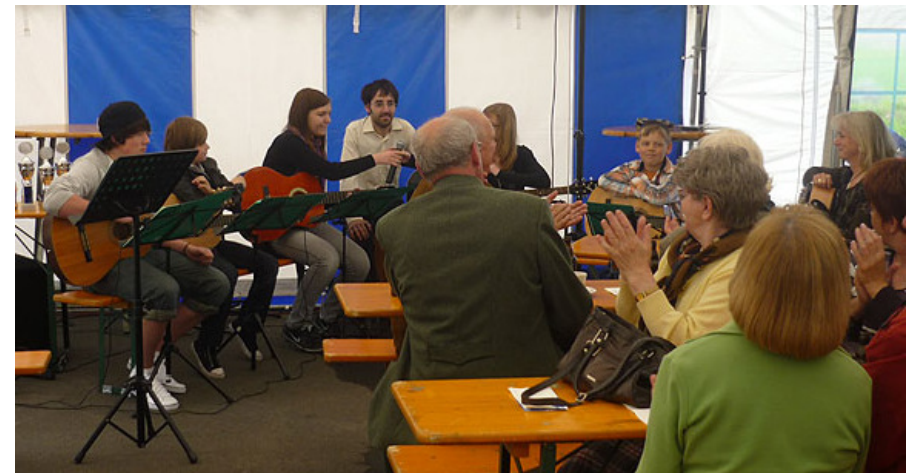
Auftritt der Gitarrengruppe beim Familienwandertag 2010