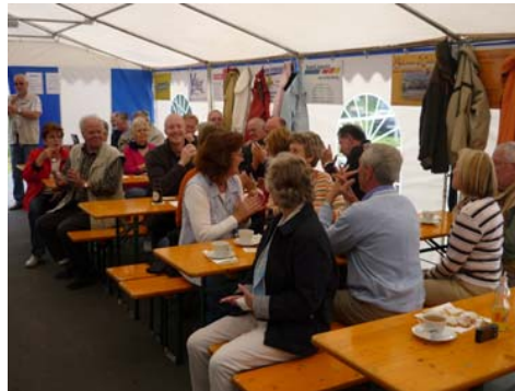
Impressionen vom Familienwandertag 2009

Es sind alle Mitbürgerinnen und Mitbürger der Gemeinde, egal ob Mitglied oder Nichtmitglied, recht herzlich eingeladen und willkommen. Treffpunkt ist um 14.00 Uhr vor der Kirche.