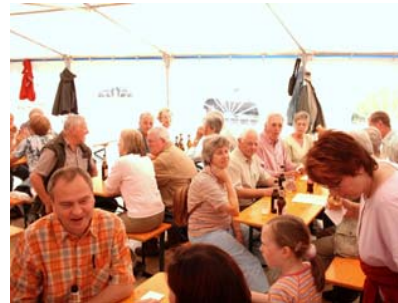
Impressionen vom Familienwandertag 2007

Es sind alle Mitbürger der Gemeinde, egal ob Mitglied oder Nichtmitglied, recht herzlich eingeladen und willkommen.