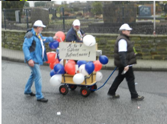
Die Bofrostmänner des MGV mit ihrem Motivwagen