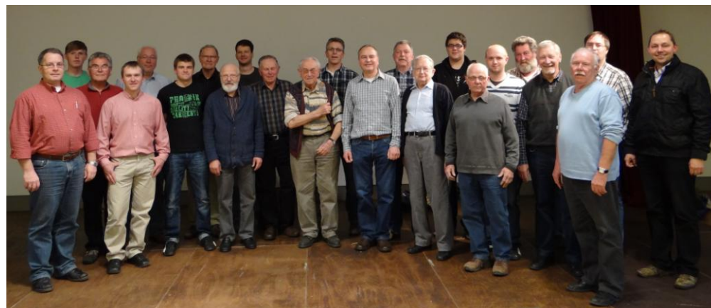
Nach der Chorprobe am 29.03.2012

Natürlich stand das Burschenlied an erster Stelle, es wurden aber auch weitere Lieder einstudiert und so waren in den letzten Chorproben einige Burschen mit von der Partie.