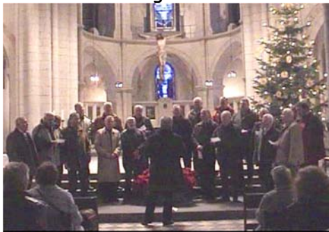
Auftritt im Limburger Dom