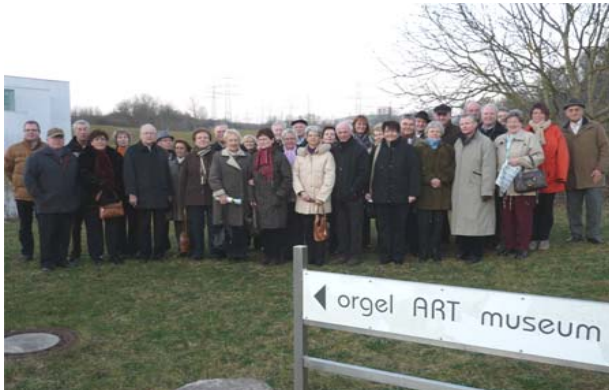
Das Bild zeigt die Teilnehmer der Jahresabschlußfahrt nach der Besichtigung des Orgelmuseums in Windesheim.