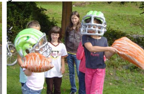
Die Teilnehmer beim GrandPrix OHO 2008