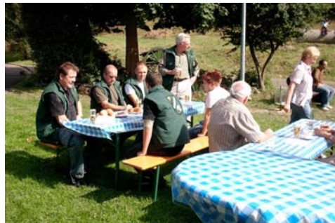
Eine Abordnung des Schützenvereins bei der Festeröffnung

Beim GrandPrix OHO - dem Wettbewerb der Dorfvereine - schlug die Stimmung hohe Wogen, denn die Teilnehmer legten sich mit ihren Darbietungen mächtig ins Zeug. Die Turnfrauen (Sieger von 2007), der Feuerwehrverein, der Verschönerungsverein und der Karnevalsverein maßen sich im Wettstreit um den Wanderpokal, der in diesem Jahr angeschafft wurde. Am Ende mussten sich die Titelverteidiger mit dem Karnevalsverein den dritten Platz teilen. Mit den Mitsing- und Schunkelliedern "Dicke Mädchen" und "John Browns Mutter" kassierte der Feuerwehrverein den Pokal vor den Sängern aus dem Verschönerungsverein. Die Zeit der GrandPrix-Auswertung wurde durch eine Tombola (jedes Los war ein Gewinn) überbrückt. Anschließend feierten die Wettkämpfer und die Gäste noch kräftig bis zum Einbruch der Morgendämmerung. Mit herrlichem Wetter startete dann am Sonntagmorgen der Frühschoppen mit Weißwurst und Brezeln. Zur Mittagszeit gab es noch andere bayrische Spezialitäten.